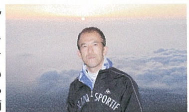
家族で登った富士山でのご来光

本題 今回よりパドタマ編集に参加させてもらっています。まだまだ小間使いですが、今後とも皆様よろしくお祈りします!新企画コーナーも募集中!